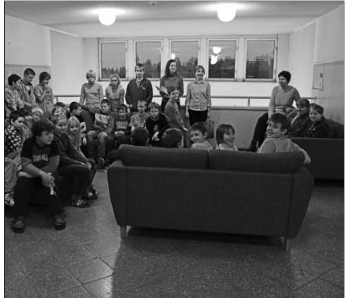
Koolipere on tänulik annetatud diivanite eest.