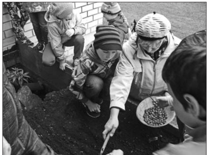
Meie oma tammed said maha külvatud ja koguvad jõudu kooli parki istutamiseks.