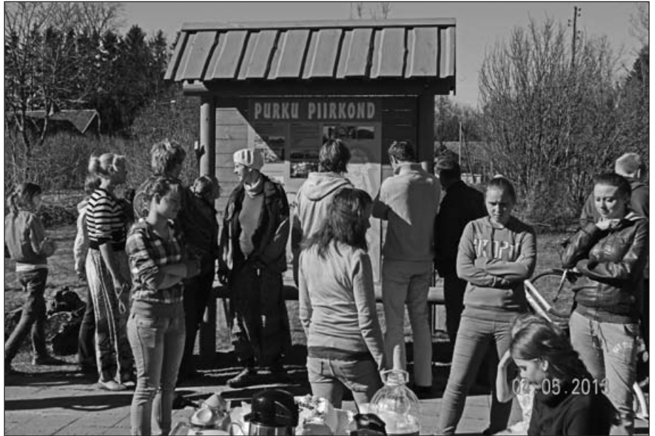
Külatahvli avamine 4. mail 2013.