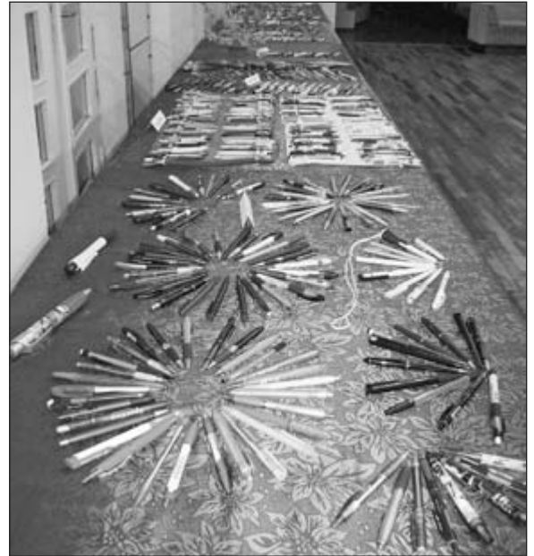
Pastapliiatsite näitusel oli väljas üle tuhande kirjutusvahendi.

sesse jõulupeole Raikküla valla koduseid lapsi koos vanemate ja vanavanematega. 18. detsembril on memme-taadi jõulupäev – pidu Raikküla valla eakatele. 30. detsembril toimub aastalõpupidu. Kõigest täpsemalt lugege kuulutustelt, võimalusel külastage kultuurikeskuse blogilehekülge.